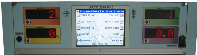
Frontal Equipo Arco A-2010 V3.0 A03506503